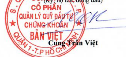
Cùng Trần Việt

Ghi chú: (*) Chỉ tiêu này chỉ áp dụng đối với công ty cổ phần