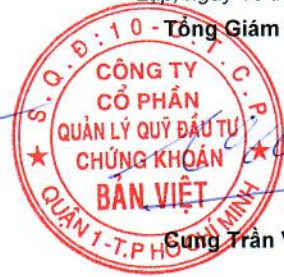
Sung Trần Việt